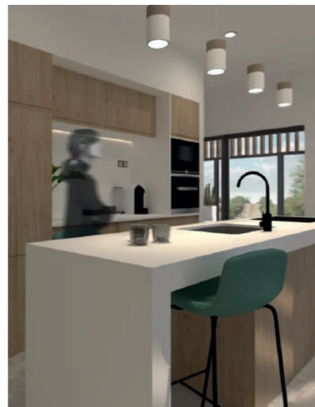
Raíces Interiores Amparo del Rosal, TFG

En el grado de diseño de interiores aprenderás fotografía, creatividad, sostenibilidad, luminotécnia, espacios comerciales, mediciones, materiales de construcción y otras asignaturas para sacar el mayor partido a tus proyectos.